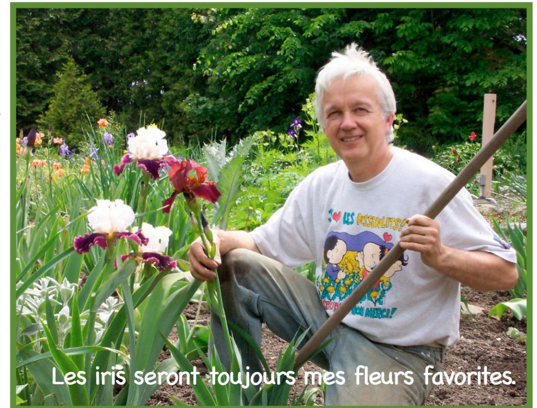
Les iris seront toujours mes fleurs favorites.

Avec le recul, ce n'est pas la note qui comptait, mais l'heureuse rencontre des formes et des couleurs que cette plante me dévoilait et que la nature avait si délicatement décorée. Ma sensibilité était agréablement touchée, je suis dorénavant très reconnaissant envers ce que la nature m'offre, me donne et surtout ce que je peux cultiver aujourd'hui. Un lien presque sacré s'est créé avec la terre (inconsciemment au début) et a modelé ma vie, ma relation avec ma famille, et surtout avec mes ami(e)s jardiniers avec lesquels j'ai toujours la chance de partager de belles expériences.